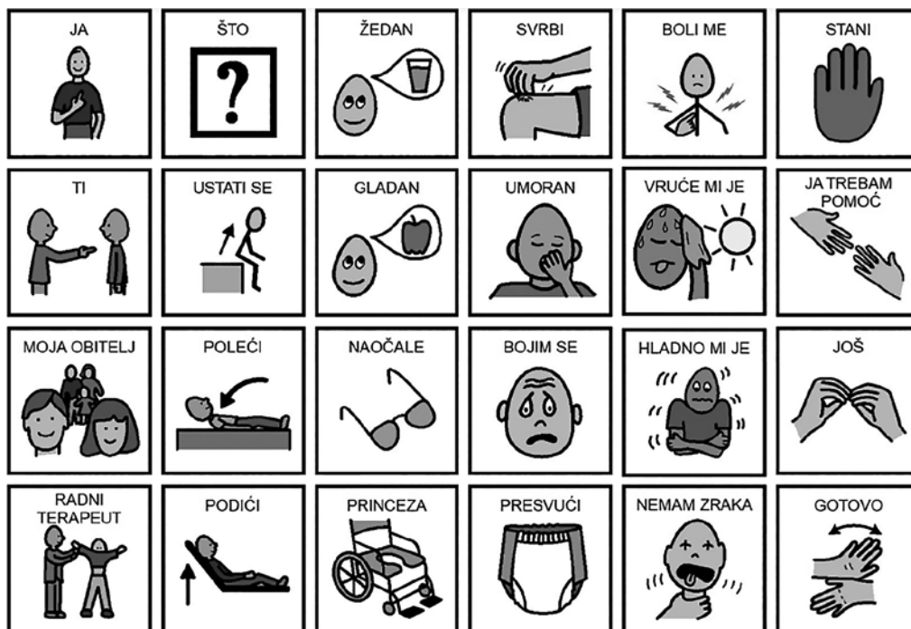
Slika 1. Primjer komunikacijske ploče za medicinsku sestru

te da pozitivna neverbalna poruka u njima izaziva ugodne verbalne i neverbalne odgovore, a negativna povlačenje i neugodu (Gendron, 2011.). Autori istraživanja također upozoravaju da dulje ostaju očuvane vještine čitanja i pisanja te one pragmatične (Bourgeois, Fried-Oken, Rowland, 2010.). Također ističu da senzoričke informacije koje su važne osobi i koje su njezin sustav razumijevanja svijeta, mogu joj biti nit vodilja (Ayles, 1997.).